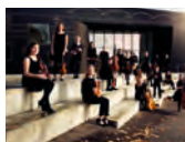
Det danske Ungdomsensemble Danmark