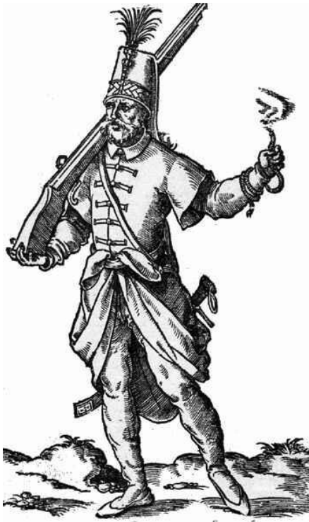
Osmannisk kriger med "støjinstrument" i venstre hånd.

Da den 22-årige Mozart i 1778 skrev sin klaversonate nr. 11 i A-dur KV 331 og her som sidste sats den berømte Rondo alla Turca , skrev han sig ind i en tradition, som vi også kender fra f.eks. Mozarts opera Bortførelsen fra Seraillet (1782), sidste sats af Franz Joseph Haydns symfoni nr. 100 i G-dur "Militærsymfonien" (1794) eller som et sent eksempel: sidste sats af Beethovens 9. symfoni op. 125 i d-mol (1824). Mozarts sats kaldes undertiden også "tyrkisk march" som en reminiscens af militærmusikken.