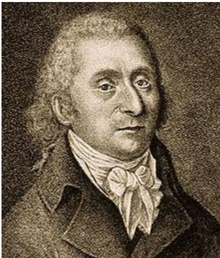
Franz Anton Hoffmeister

Fløjten blev i det 18. århundrede et meget populært instrument blandt et stadigt voksende antal amatørmusikere, og der var således et stærkt stigende marked for fløjtemusik, hvilket passede Hoffmeister udmærket, da han ud over at være komponist også var en kendt musikforlægger.